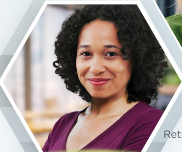
Retratos de pacientes